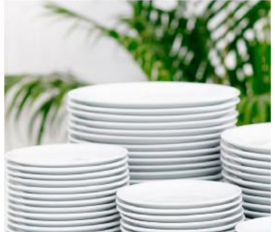
Kuva: Työaikainen ruokailusuositus (VRN)