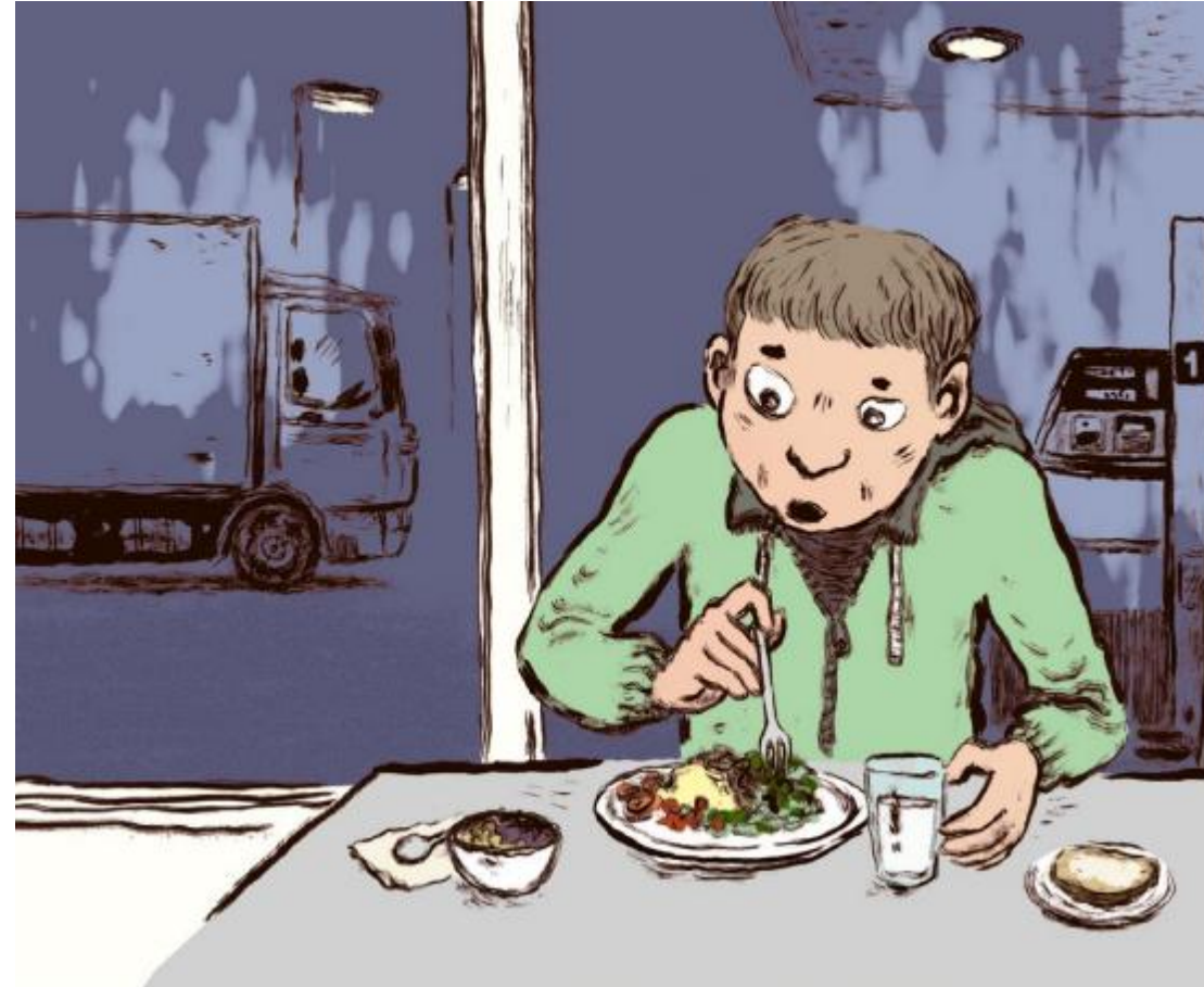
Kuva: Työaikainen ruokailusuositus (VRN)

Mahdollisuus työaikaiseen ruokailuun vaihtelee toimialoittain.