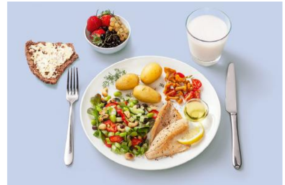
Kuvat: Työaikainen ruokailusuositus (VRN)