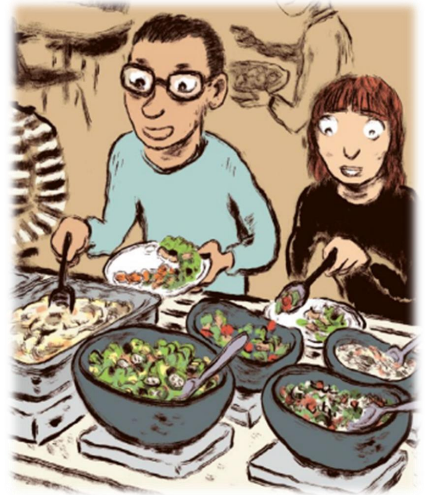
Kuva: Työaikainen ruokailusuositus (VRN)