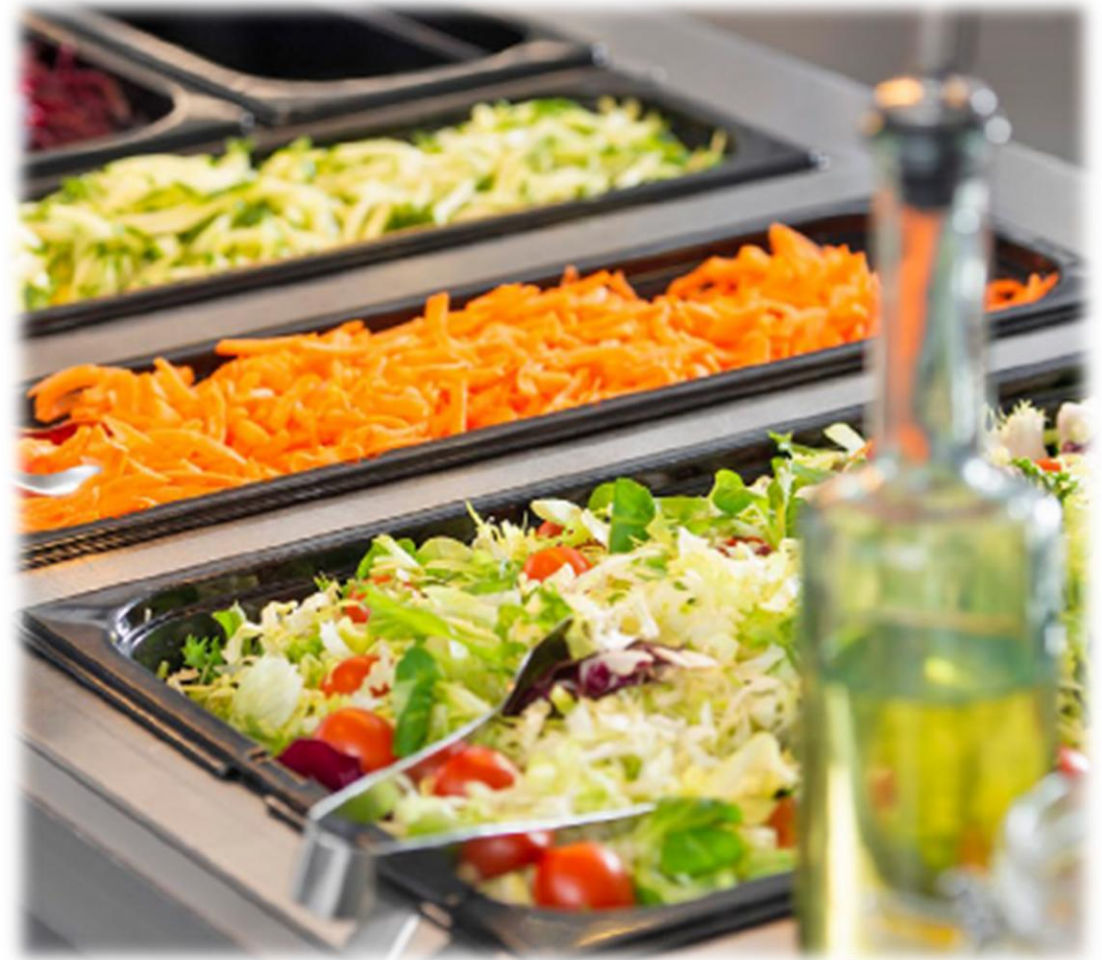
Kuva: Työaikainen ruokailusuositus (VRN)